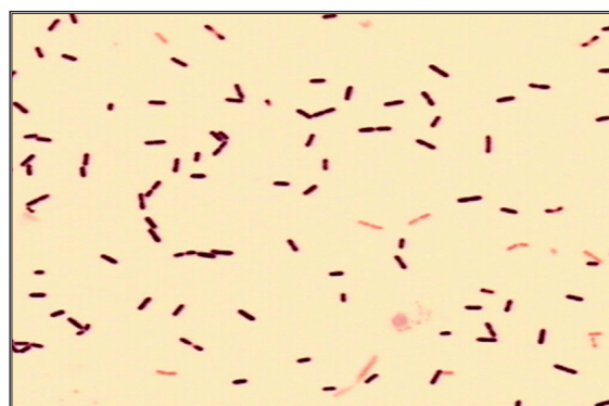
Figura 2. Coloración de Gram de cultivo de líquido cefalorraquídeo. Se observan numerosas formas de bacilos grampositivos indicativos de Listeria monocytogenes .

Actualmente, L. monocytogenes es la causa de 8% de todas las meningitis bacterianas en el adulto mayor (10) . No obstante, la presencia de abscesos cerebrales es extremadamente rara y corresponde a menos de 1 %, aproximadamente.