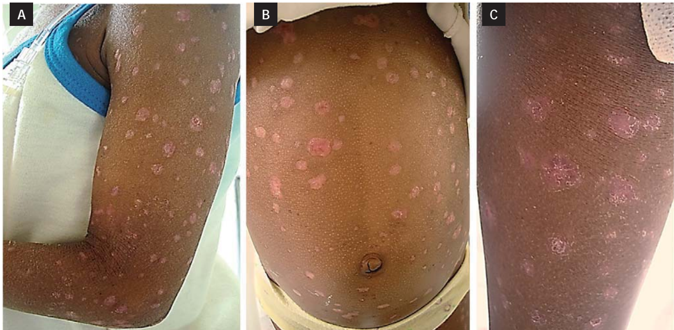
Figura 4 A, B y C Máculas y pápulas eritematodescamativas con bordes irregulares.

La paciente, durante su hospitalización, recibió aciclovir (30 mg/kg/día), clindamicina (40 mg/kg/día) y cefepime (150 mg/kg/día) endovenoso durante 14 días, soporte nutricional adecuado, terapia física y curaciones por clínica de heridas, presentando una recuperación satisfactoria de sus manifestaciones clínicas (fig. 4).