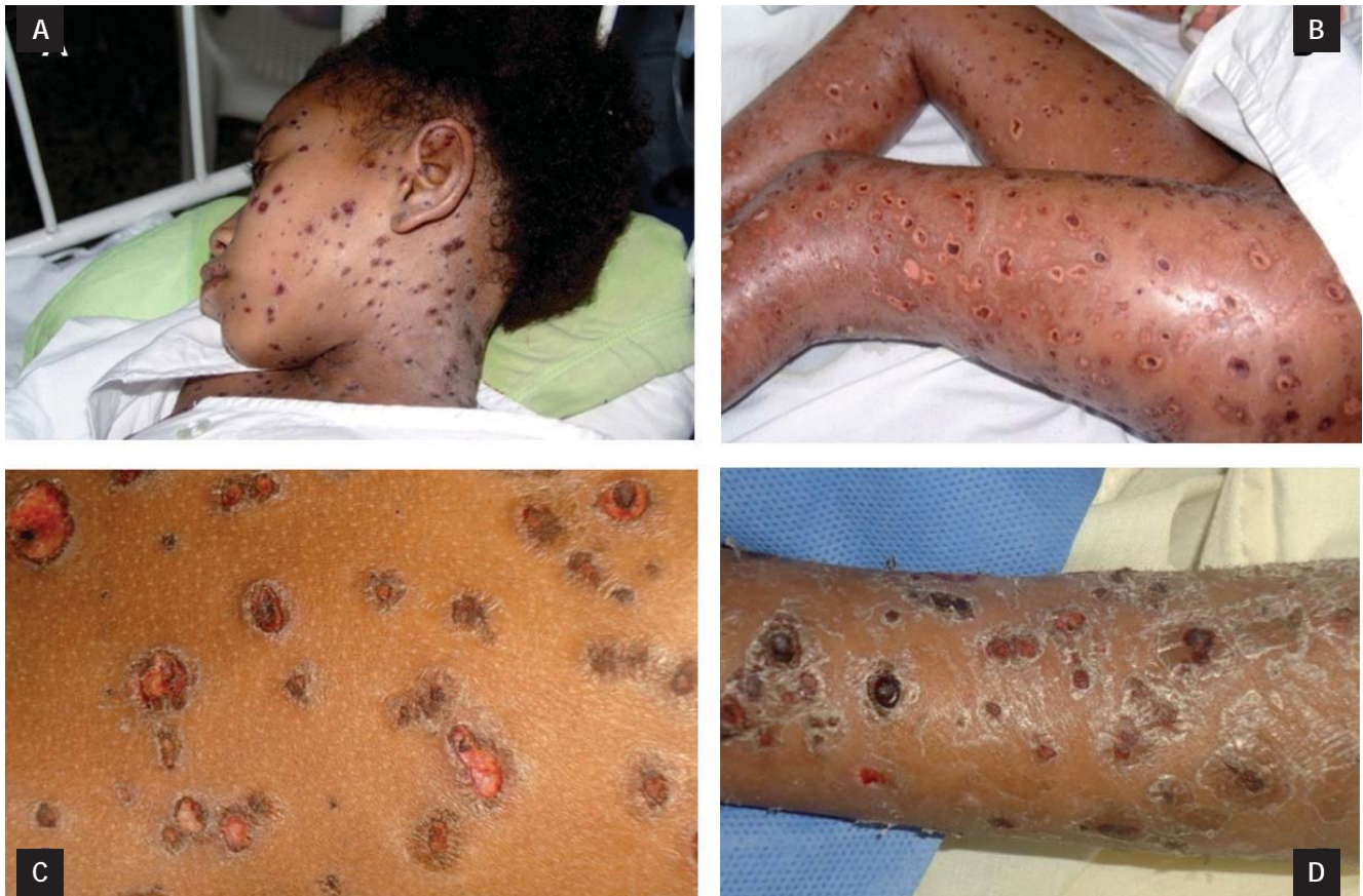
Figura 1 A,B,C y D. Erosiones y úlceras profundas, con costras serosas y hemáticas, redondas, múltiples, algunas en sacabocado con fondo necrótico.