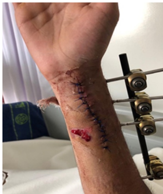
Figura 2. Imagen posterior a primera intervención quirúrgica lavado quirúrgico, retiro de material de osteosíntesis y nueva osteosíntesis de radio y cúbito.